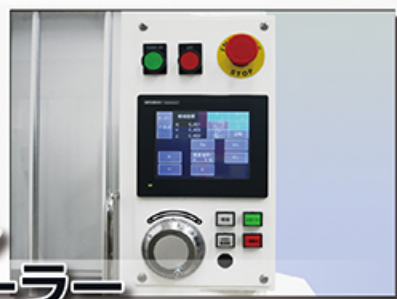
オリジナル コントローラー