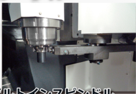
ビルトインスピンドル & アーム式ATC